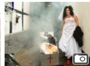
KÜRBISFEST Gruseliges Kettwig