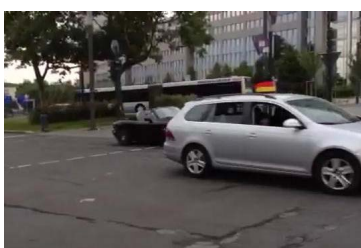
Fans feiern in Essen