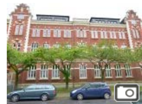
100 ORTE (99) Eltingviertel im Essener Nordviertel